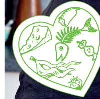
© Çevre Destek İşareti hakkı unvanı 341.834

Yiyecek atıkları için ayrıştırma kılavuzu