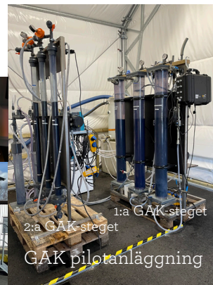
1:a GAK-steget 2:a GAK-steget GAK pilotanläggning